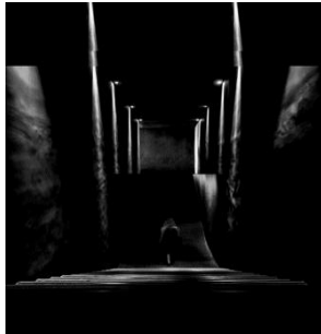
شکل ۲. شبیه‌سازی راه‌پله منتهی به دهلیز نمور در داستان شازده احتجاب

در داستان شازده احتجاب ، در پایان داستان، عنصر پله در کنار فضاهایی چون دهلیز و سردابه در خلق فضایی ابهام آمیز بین خواب و بیداری و مرگ و زندگی نقش مؤثری دارد. رمان شازده احتجاب با حرکت رو به پایین و نزولی شازده از پله‌ها و حضور در سردابه‌ای سرد و تاریک، که نشانه‌ای از مرگ و ناخودآگاهی است، به پایان می‌رسد. پله‌ها نمور و بی‌انتهای بود و شازده که می‌دانست نتوانسته است، که پدر بزرگ را نمی‌شود در پوستی جا داد، که فخرالنساء... از آن همه پله پایین‌تر و پایین‌تر می‌رفت، از آن همه پله که به دهلیز نمور می‌رسید و به آن سردابه زمهریر و به شمد و خون و به آن چشم‌های خیره‌ای که بود و نبود (گلشیری، ۱۳۶۸: ۹۵).