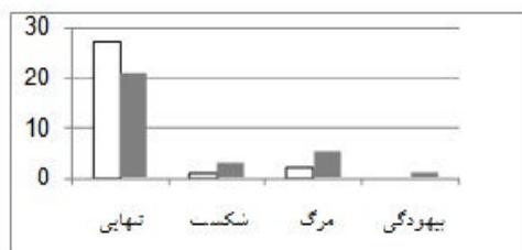
نمودار ۱. نگرش آزمودنی‌ها درباره مفهوم محوری شعر «پرنده مردنی است»

مطابق با نمودار ۱، به اعتقاد اغلب آزمودنی‌هایی که شعر فروغ فرخزاد را مطالعه کرده‌اند، مفهوم شعر «عصیان» تنهایی است. گزینه مرگ با اختلاف زیاد در رتبه دوم قرار دارد و مفاهیم شکست و بیهودگی نیز در جایگاه‌های سوم و چهارم هستند. نکته درخور تأمل اینکه آزمودنی‌های زن (ستون سفید) بیش از آزمودنی‌های مرد (ستون خاکستری) تنهایی را مفهوم هسته‌ای شعر فروغ فرخزاد معرفی کرده‌اند. چنین اختلاف دیدگاهی در خصوص شعر احمد شاملو مشاهده نمی‌شود؛ زیرا هر دو گروه زن و مرد، تقریباً به یک اندازه خفقان را به مثابه مفهوم محوری شعر برگزیده‌اند.