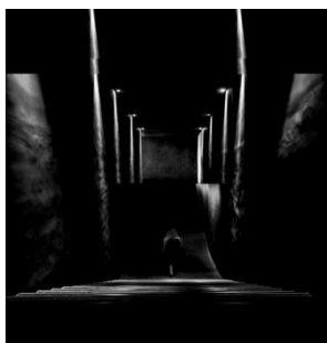
شکل ۲. شبیه‌سازی راه پله منتهی به دهلیز نمور در داستان شازده احتجاب

در داستان شازده احتجاب ، در پایان داستان، عنصر پله در کنار فضاهایی چون دهلیز و سردابه در خلق فضایی ابهام آمیز بین خواب و بیداری و مرگ و زندگی نقش مؤثری دارد. رمان شازده احتجاب با حرکت رو به پایین و نزولی شازده از پله‌ها و حضور در سردابه‌ای سرد و تاریک، که نشانه‌ای از مرگ و ناخودآگاهی است، به پایان می‌رسد. پله‌ها نمور و بی‌انتهای بود و شازده که می‌دانست نتوانسته است، که پدر بزرگ را نمی‌شود در پوستی جا داد، که فخر النساء... از آن همه پله پایین‌تر و پایین‌تر می‌رفت، از آن همه پله که به دهلیز نمور می‌رسید و به آن سردابه زمهریر و به شمد و خون و به آن چشم‌های خیره‌ای که بود و نبود (گلشیری، ۱۳۶۸: ۹۵).